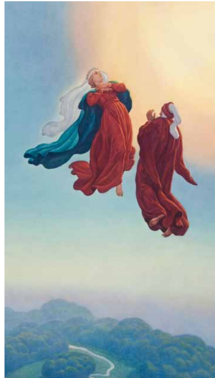
Amos Nattini, Paradiso canto I (part.) Collezione privata

Nelle sue illustrazioni, permeate dal romanticismo dell'epoca, prevalgono intonazioni delicate e rimandi classici. Scaramuzza è un artista in bilico tra passato e futuro, che simbolizza tutte le incertezze di un'Italia appena nata che vede in Dante uno dei suoi padri.