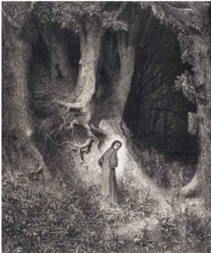
Gustave Doré, Inferno canto I (part.) Collezione privata

Nell'anno delle celebrazioni del 750° anniversario della nascita di Dante Alighieri il Museo d'Arte della città di Ravenna partecipa alle manifestazioni in onore del Sommo Poeta con un'importante mostra curata da Stefano Roffi e realizzata in collaborazione con la Fondazione Magnani Rocca di Mamiano di Traversetolo (Parma). La Divina Commedia è una delle più grandi opere della letteratura di tutti i tempi, in grado di agire profondamente sull'immaginario collettivo e sugli artisti.