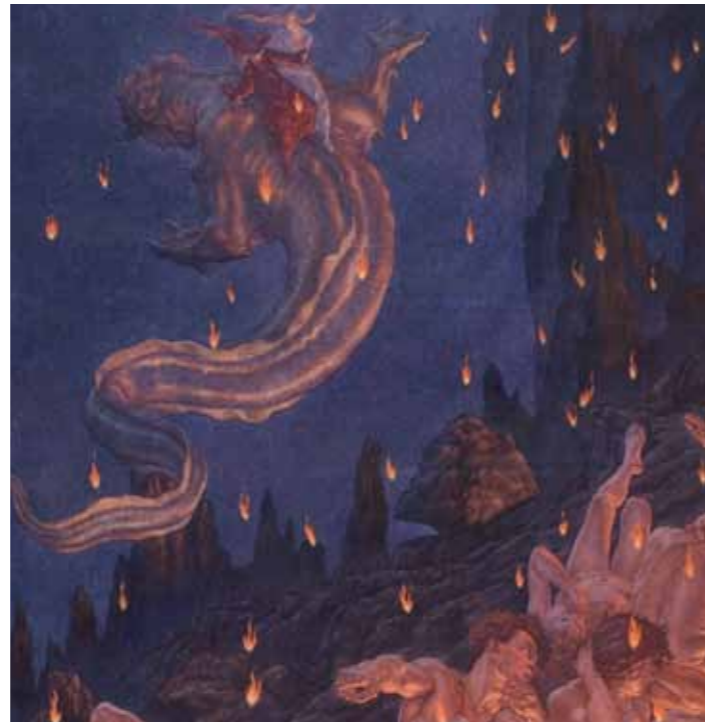
Amos Nattini, Inferno canto XVII (part.) Collezione privata

Le illustrazioni di Francesco Scaramuzza e Amos Nattini possono essere considerate le più importanti interpretazioni dell'opera dantesca compiute in Italia e, grazie al confronto diretto con le celebri incisioni di Gustave Doré, la mostra offre al visitatore un percorso ricco di accostamenti insoliti, diacronici e suggestivi. Una sezione della mostra è dedicata all'esposizione integrale delle illustrazioni di Scaramuzza, risalenti agli anni Sessanta dell'Ottocento, poste in dialogo con le coeve opere di Doré, l'altra sezione ospita tutte le cento tavole di Nattini, realizzate tra 1919 e 1939. Le opere esposte, oltre 500 tra incisioni, acquerelli e un olio, permettono un'immersione figurativa nella visione dantesca, così come è stata recepita nella modernità. Le illustrazioni di Gustave Doré (Strasburgo, 1832-Parigi, 1883) vengono pubblicate dal 1861 fino al 1868 e, nel 1865, anno della prima edizione italiana de l'Enfer , Francesco Scaramuzza (Sissa, 1803 - Parma, 1886) inizia a lavorare ai disegni per il suo Inferno.