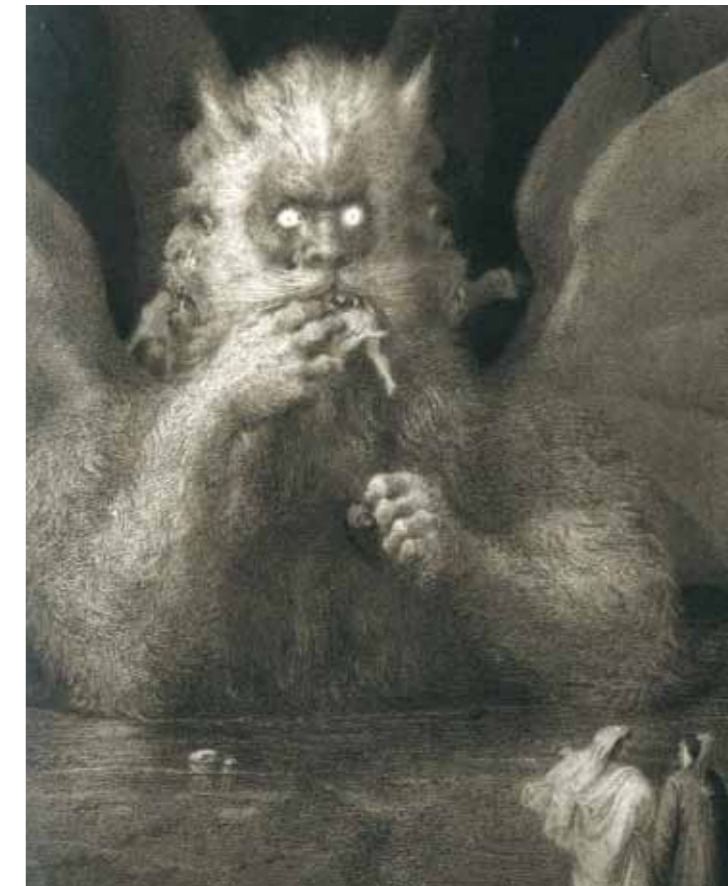
Francesco Scaramuzza, Inferno canto XXXIV (part.) Collezione privata

Un'intera sezione del percorso espositivo è dedicata alle illustrazioni di Amos Nattini (Genova, 1892 - Parma, 1985), il cui grandioso progetto di trasporre in cento tavole il poema dantesco ottenne da subito un grandissimo successo. Nattini trae probabilmente ispirazione dalle visionarie illustrazioni dantesche di William Blake anche per quanto riguarda la tecnica, l'acquerello, che gli permette di creare atmosfere evocative e fantastiche. Il catalogo presenta un saggio di Emanuele Bardazzi e Francesco Parisi sul tema "L'illustrazione della Divina Commedia attraverso i secoli" e testi di Mauro Carrera, Anna Mavilla, Cinzia Cassinari, Stefano Roffi dedicati ai protagonisti della mostra.