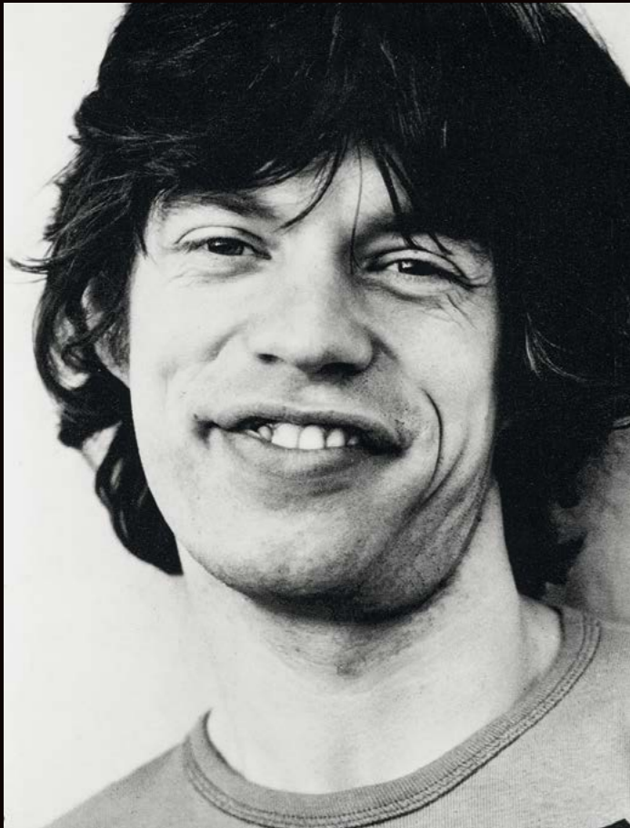
Oliviero Toscani, Mick Jagger, 1973