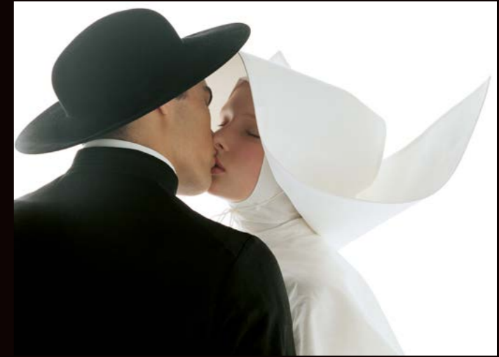
Oliviero Toscani, United Colors of Benetton, 1992