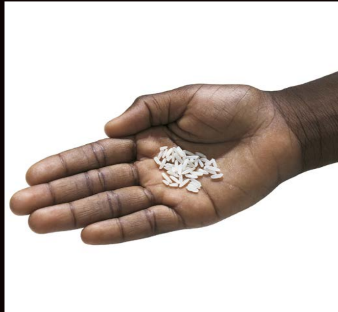
Oliviero Toscani, United Colors of Benetton, 1996, ©olivierotoscani

Non manca la serie Razza Umana , uno studio socio-politico, culturale e antropologico attraverso il quale Toscani ha analizzato la morfologia degli esseri umani per comprenderne le differenze, "prendere impronte somatiche e catturare i volti dell'umanità".