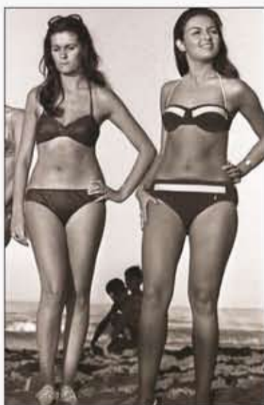
A Riccione si presenta il libro "Pico"