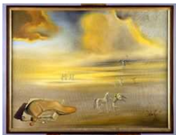
"Mostro molle in un paesaggio angelico" di Salvador Dalí.

Una bella mostra al Mar esplora la produzione pittorica di figure emarginate dalla società, accostandole a opere di nomi famosi che hanno indagato il tema.