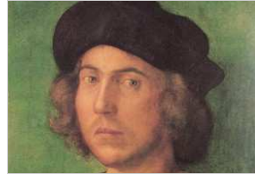
RITRATTO DI GIOVANE ALBRECHT DÜRER PALAZZO ROSSO