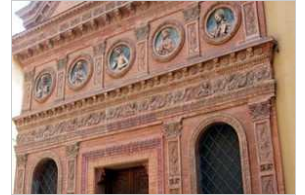
ORATORIO DELLO SPIRITO SANTO BOLOGNA