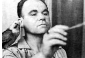
LUIGI FILIPPO TIBERTELLI (FILIPPO DE PISIS)