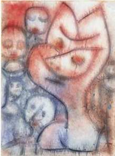
Paul Klee, Gebärde eines Antlitzes, 1939, colore a colla, acquarello e matita su carta, Museo del territorio biellese