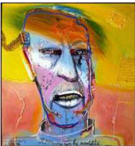
Mattia Moreni, Autoritratto n.2, 1986, olio su tela, Galleria d'Arte Contemporanea Vero Stoppioni, Santa Sofia (FC)

All'interno dei " Ritratti dell'anima " ampio spazio è dedicato ad una sequenza di ritratti e soprattutto autoritratti, una delle forme di autoanalisi inconsapevole più frequente nei pazienti