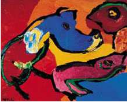
Karel Appel, Senza titolo, 1971, olio su tela, cm 55x81, Collezione in Ca' La Ghironda, Modern Art Museum, Zola Predosa (Bo)

Infine, nel " Sogno rivela la natura delle cose " (titolo che richiama una mostra della Fondazione